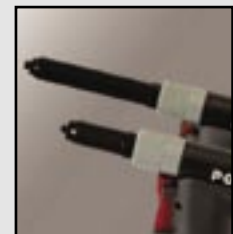
Wydłużona końcówka przedn