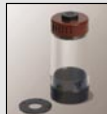
Zestaw modernizacyjny MCS